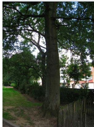
, 29 Juillet 2008

XLSX (Excel 2007) - XLS (Excel 1997-2003) .